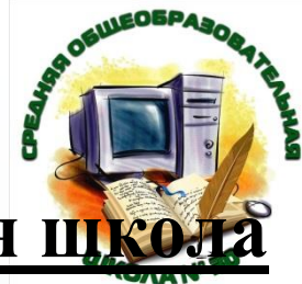
ГРАФИК ПРИЕМА ДОКУМЕНТОВ

в 1 класс МАОУ «Средняя общеобразовательная школа