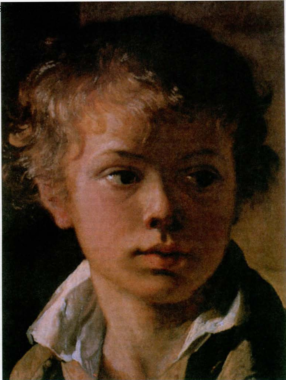
В. Тропинин. Портрет сына. Масло

Пусть сегодня он, мечтая, смотрит в голубое небо и верит в огромную силу добра. Пусть сам он будет добр к миру природы и миру людей!