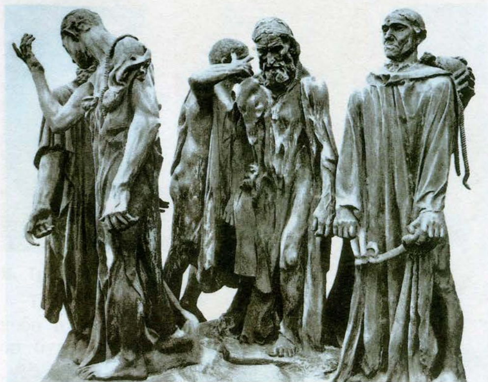
О. Роден. Граждане Калé. Бронза. Франция, г. Кале

Создай в скульптуре эскиз памятника народному герою.