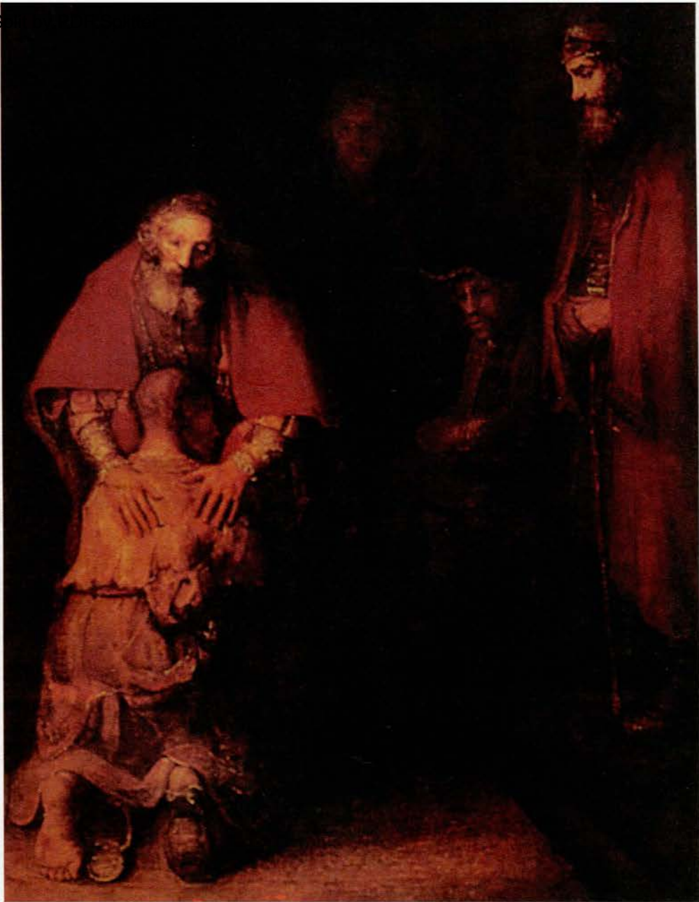
Рембрандт. Возвращение блудного сына. Масло

шегося отца ласка. Золотые, коричневые и красноватые оттенки цвета согревают картину внутренним теплом, мерцают и светятся. Всё замерло. И кажется, что совершается чудо, доброе волшебство встречи, всепрощения.