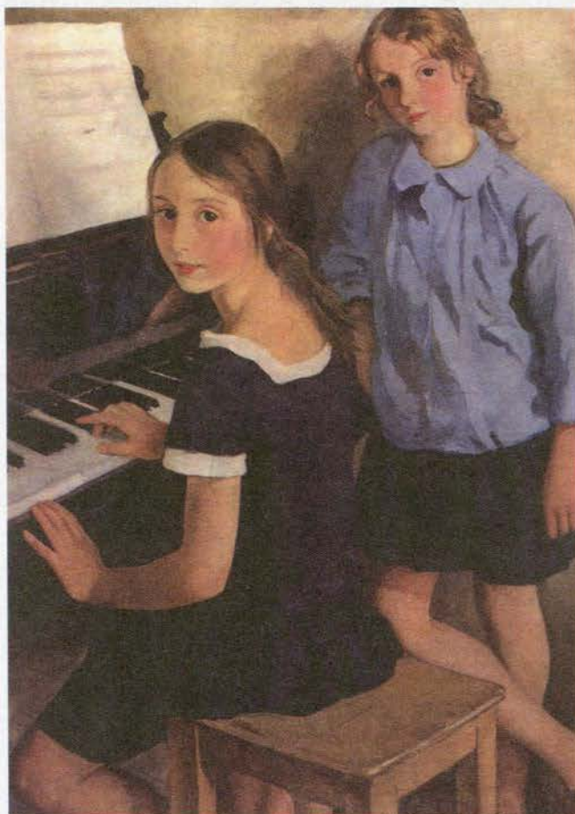
З. Серебрякова. Портрет дочерей. Масло

Глаза мальчика с портрета замечательного русского художника В. Тропинина смотрят в наш мир пытливо. Он задаёт ему вопросы. И мальчику же отвечать на них, когда он вырастет.