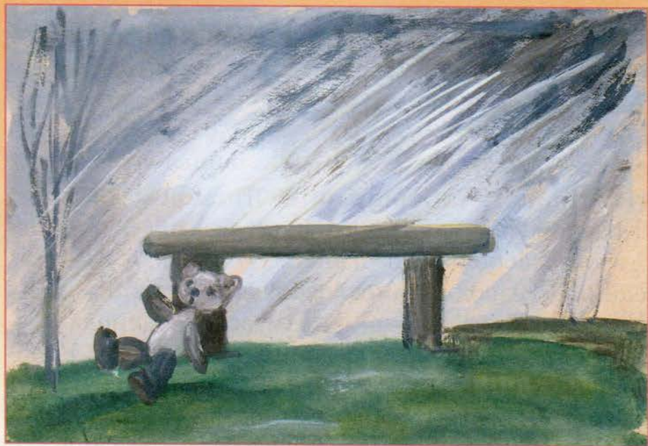
Детские работы. Гуашь